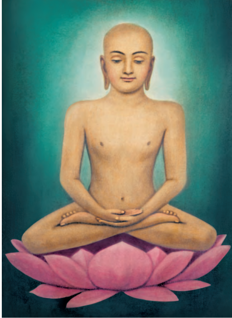
श्री भड्ढावीर वर्धमान स्वाभी